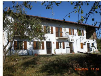
Casa Hall a Longagnano

Nello shiatsu attraverso il tatto fra il terapeuta e il ricevente si stabilisce un rapporto di reciproca comprensione. La sensibilizzazione prodotta